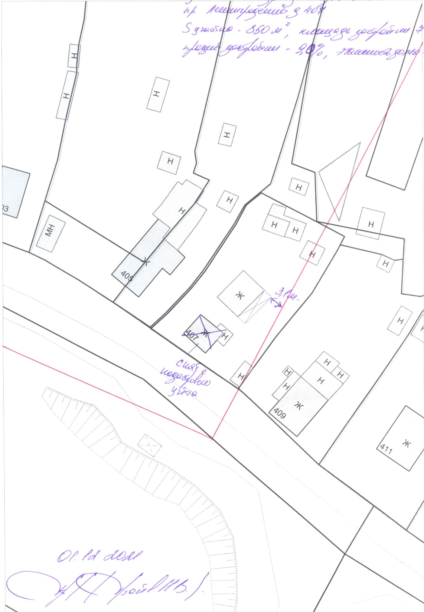
Схема расположения земельного участка по адресу г. Архангельск ул. Ленинградский 407 С здания - 850 м 2 , площадь застройки 490 м 2 прежде застройки - 9,0%, площадь застройки - 17,5%